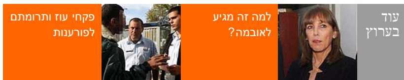
פקחי עז ותרומתם לפורענות